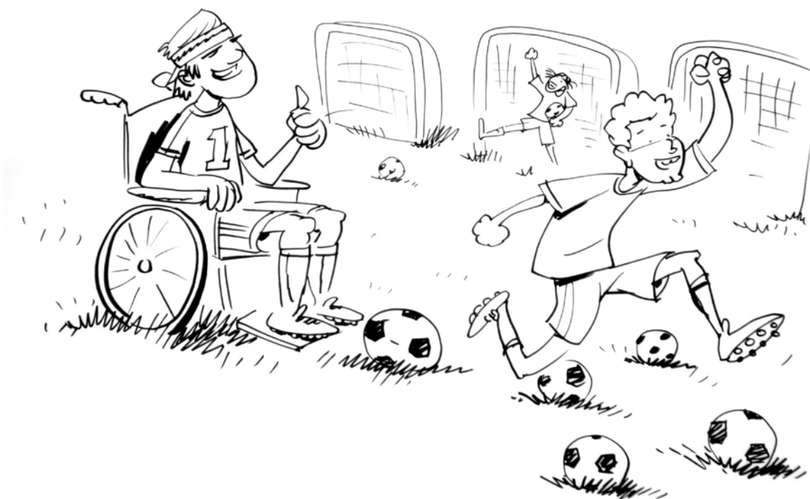
Tegningen er fra Socialpædagogernes kongres 2012, hvor deltagerne i grupper arbejdede med pejlemærkerne. Dette er en af gruppernes illustration af 'Et menneskeligt netværk',