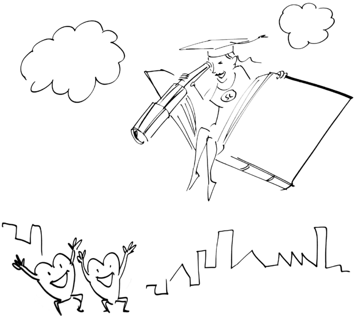
Tegningen er fra Socialpædagogernes kongres 2012, hvor deltagerne i grupper arbejdede med pejlemærkerne. Dette er en af gruppernes illustration af 'Fagligt stærke miljøer',