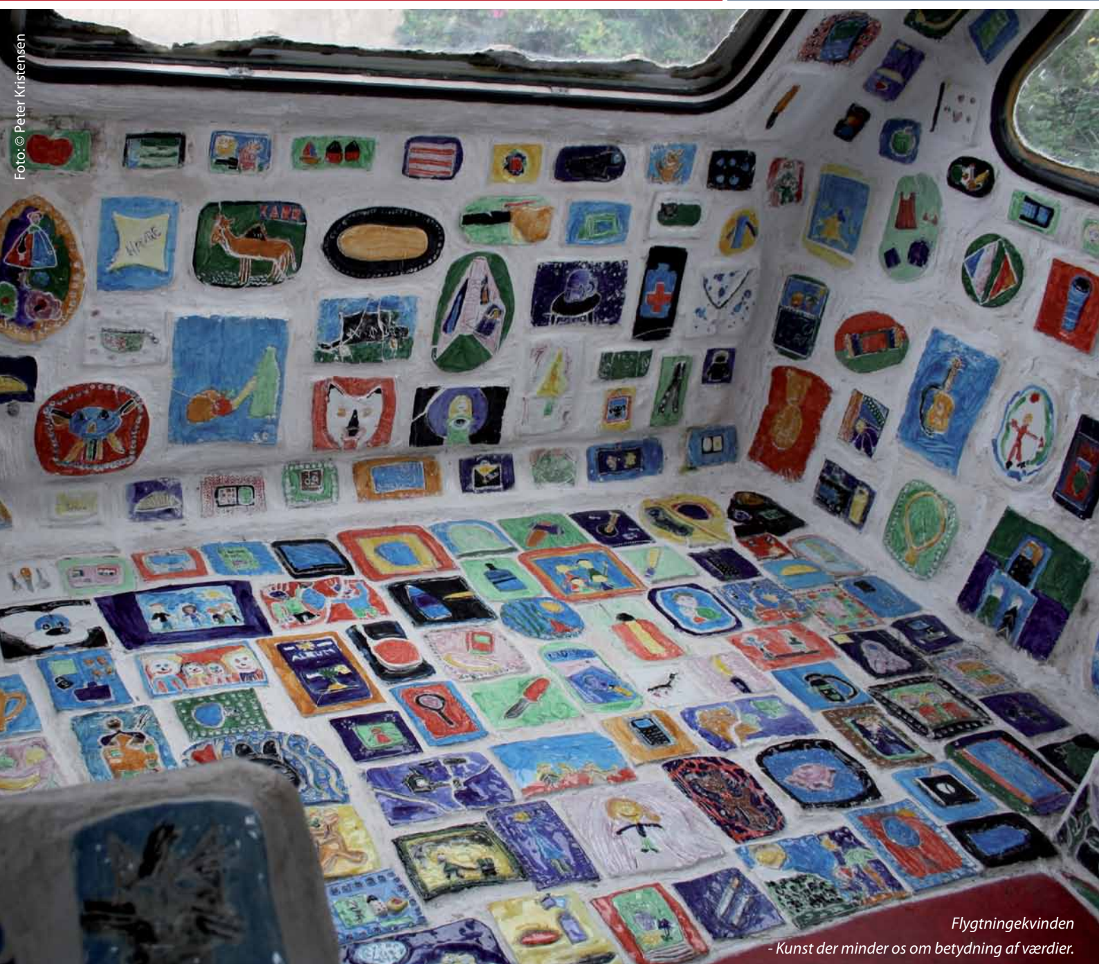
Flytningekvinden - Kunst der minder os om betydning af værdier.