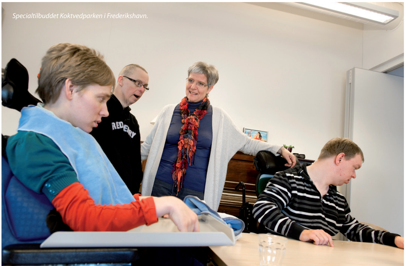
Specialtilbuddet Koktvedparken i Frederikshavn.

I denne proces lukker man ned for eksisterende tilbud med den konsekvens, at en del ekspertise forsvinder eller bliver spredt ud i flere forskellige tilbud.