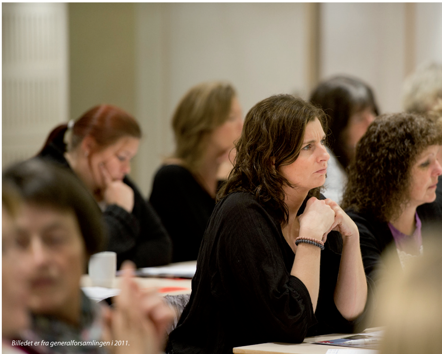
Billedet er fra generalforsamlingen i 2011.